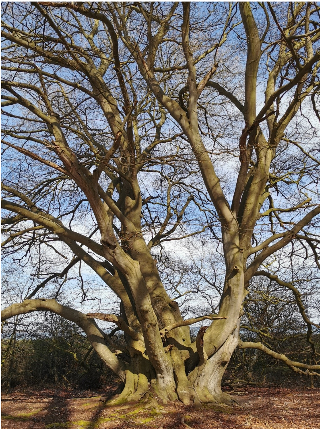
Langs kysten af Kajbjerg Skov findes stedvis nogle gamle og skulpturelle bøg og eg, som er levested for mange forskellige organismer.