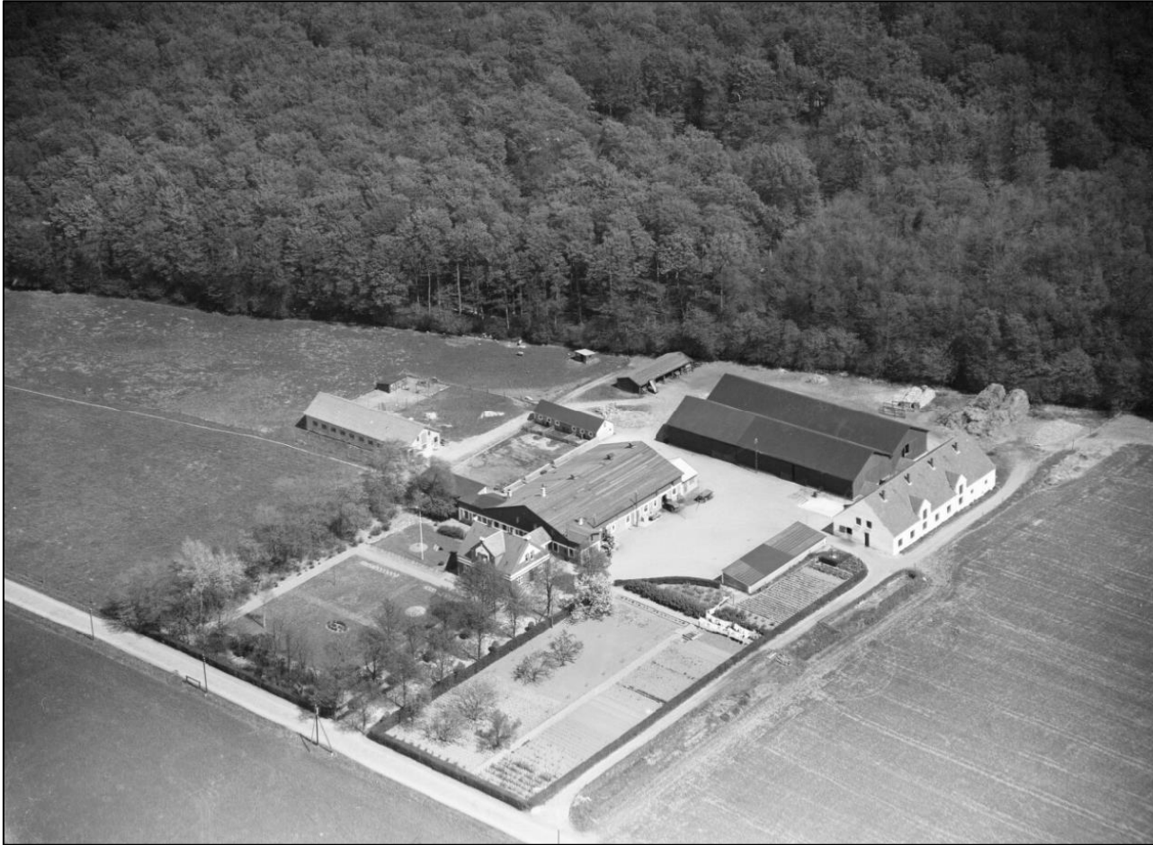
Luftfoto fra 1936-1939, hvor daværende bygninger ses opført på grunden.