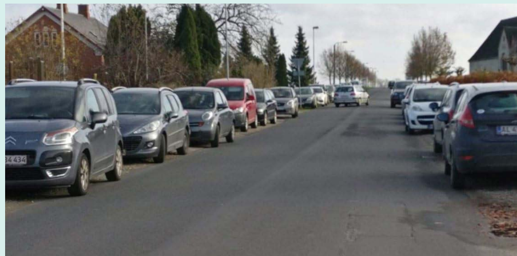
Parkering langs vejen ved Forsamlingshuset

2. Udvidelse af parkeringsområdet omkring Forsamlingshuset. Der er et ønske om opkøb af jord, evt. ved nabohuset (et udlejningshus), da der ikke er mulighed for at parkere eller at lave et legeområde. Det betyder, at bilerne i dag holder på de fire pladser, der er, samt på vejen. Det giver flere farlige situationer, da børnene, som deltager i aktiviteter/arrangementer i huset, ikke har noget udeplads og derfor bruger vejen.