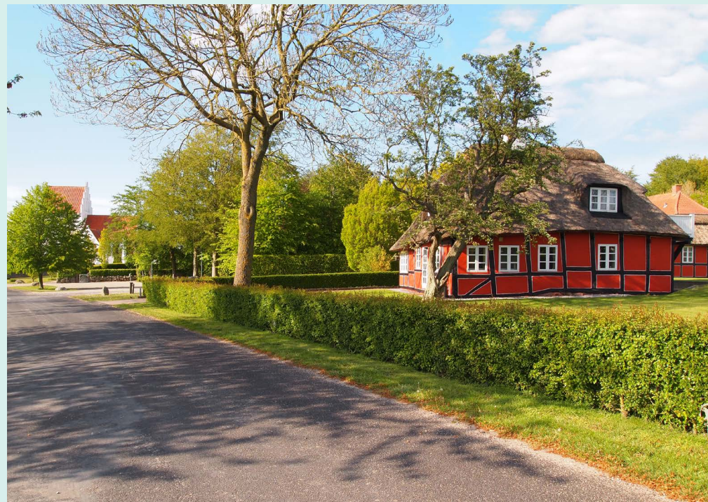
Et eksempel på landsbyens særlige karakter

I erkendelse af, at udvikling i landdistrikterne kræver en vis vedholdenhed for at få succes, ønsker Byrådet, at der gennem særligt fokus på landsbyer og landdistrikter udarbejdes en landdistriktspolitik og en udviklingsplan for alle landsbyerne, herunder for Skellerup. Udviklingsplanen skal sikre, at landsbyerne kan udvikle sig inden for rammerne af en overordnet plan. Udviklingsplanen skal medvirke til, at landsbyerne forbliver attraktive bomiljøer, samt forhindre stagnation og direkte forfald.