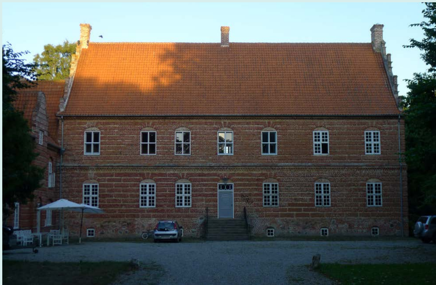
Juulskov Gods Hovedgård

et hus ved kirken til 8 fattige og 2000 rdl. til bevaringen af dette. Fæstegodset blev dog solgt fra allerede i 1800-tallet. Juulskov blev købt af den berømte "gods-slagter" Søren Hillerup i 1804, hvorefter frasalget startede.