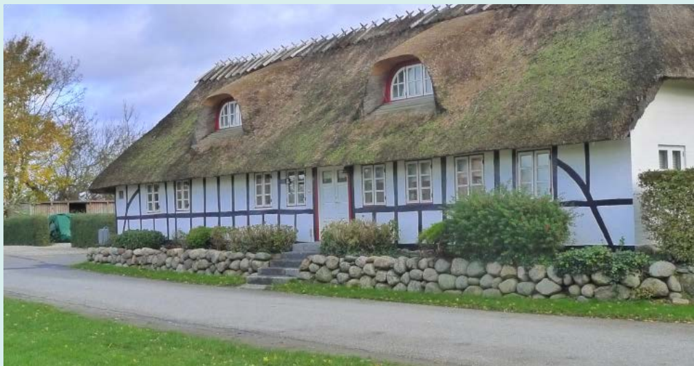
Kullerup Byvej 3