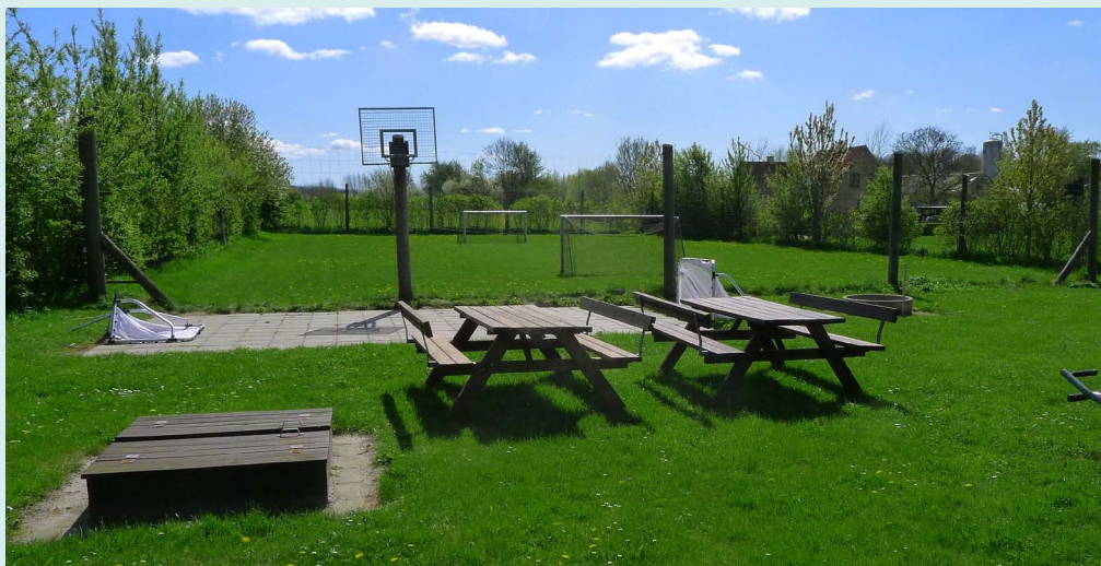
Pletten – Arealet er lejet af Nyborg kommune, og det er indrettet af Landsbyrådet og anden frivillig arbejdskraft

Pletten benyttes ikke i ønsket grad af landsbyens børn – muligvis fordi de fleste børn skal benytte den trafikerede Ferritslevvej for at komme dertil.