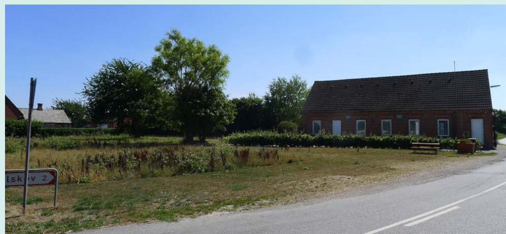
Hjørnegrunden Ferritslevvej-Kullerupbyvej kunne blive en fremragende P-Plads