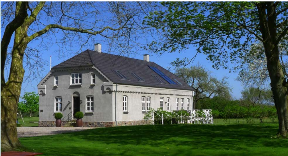
Rejsbureauet "China Experience" har til huse den sidst opførte præstegård

I Kullerup er der større og mindre landbrug med dyrehold, agerbrug og frugtplantager, der er mindre erhvervsdrivende som for eksempel elektriker, vognmand, tømrer, kursus-sted, rejsebureau og fodterapeut, der er familier med børn, der er ældre mennesker og der er erhvervsaktive, som pendler til og fra arbejde længere væk.