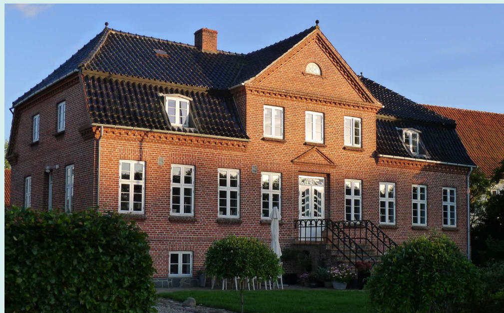
Kullerup Byvej 7, Tegnet af arkitekt Ejnar Mindedal

Gadekæret og de mindre bække, som løber gennem området er med til at trække naturen helt tæt på beboelserne.