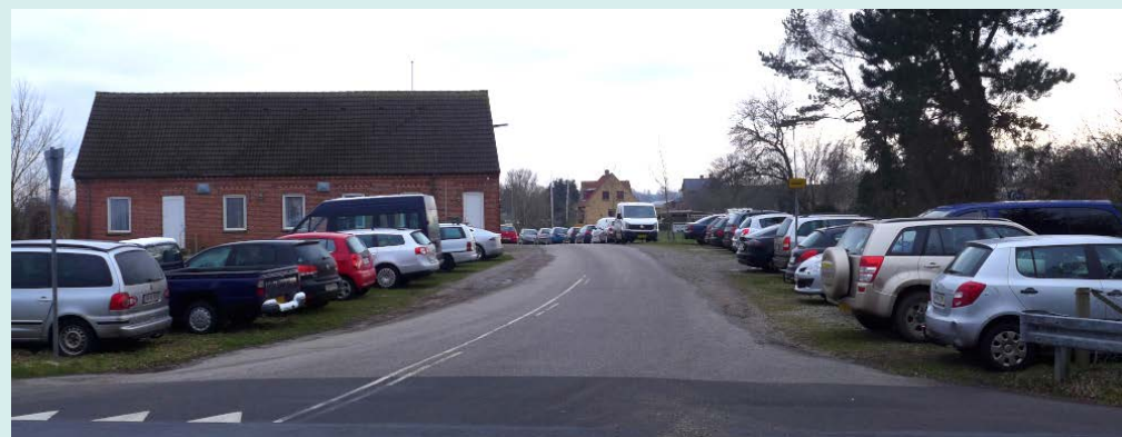
Kullerup Forsamlingshus. Bygget 1909 før der fandtes biler. P-Plads savnes