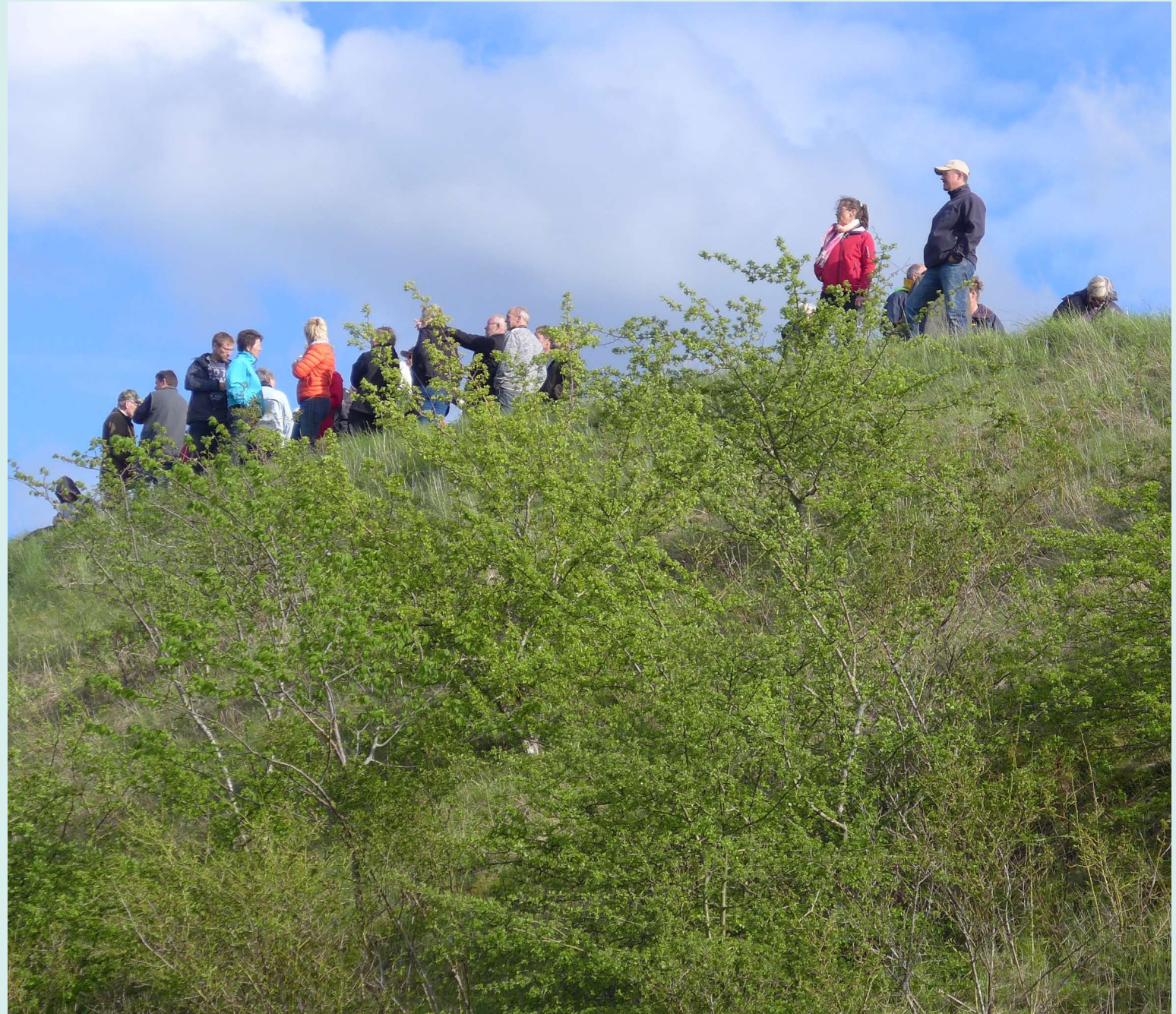
Travetur til Bjerget, hvor der er en unik flora og fauna