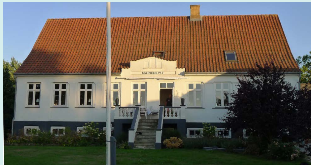
Kullerup bygade 9, Marienlysts