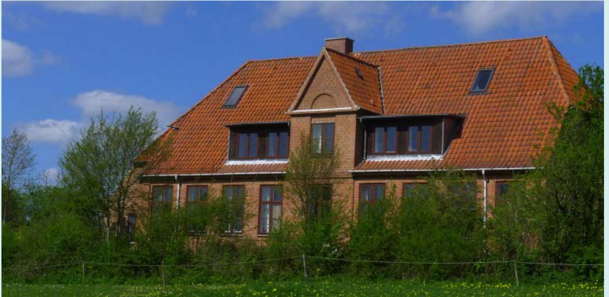
Landsbyskole fra 1930 - ca. 1960 - Tegnet af Arkitekt Ejnar Mindedal – Nu Kursussted