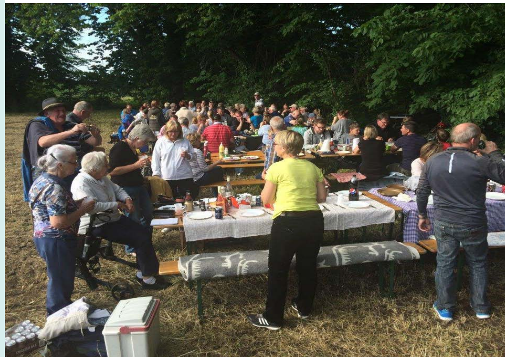
Picnic før Skt. Hansbålet tændes

Vest for kirken - på den anden side af Kullerup-renden – ligger Kirkelunden. Kirkelunden er privat område. På Kirkelundens åbne område holdes den årlige Skt. Hans fest med bål, grill, snobrød og medbragt mad.