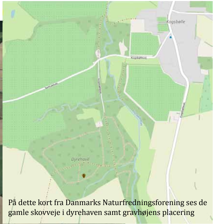
På dette kort fra Danmarks Naturfredningsforening ses de gamle skovveje i dyrehaven samt gravhøjens placering